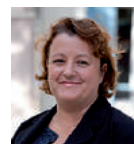
Frédérique Calandra, Maire du 20 e arrondissement