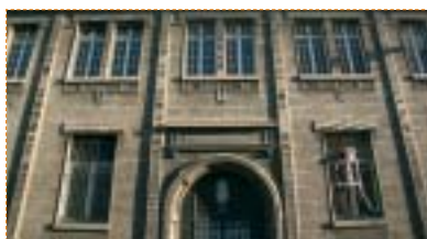
Le collège sera aménagé dans les bâtiments des Messageries

Cette réflexion de fond permet d'identifier un certain nombre de questions, sur l'énergie, sur la gestion de l'eau, sur le lien social et de faire des suggestions. La Charte de développement durable, élaborée à l'issue de ce travail, met en lumière cinq objectifs fondamentaux.